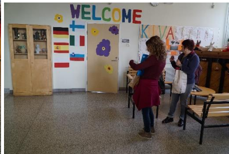
Spoznavanje dela na šoli ... našli smo tudi naše dopisovalce.