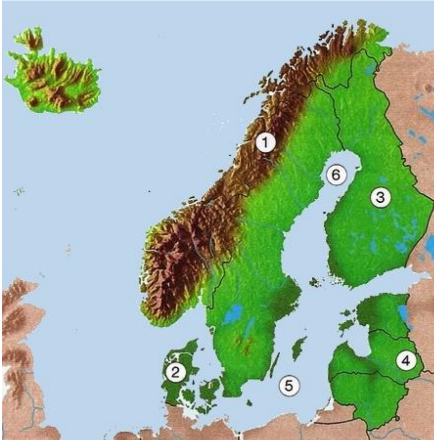
NARAVNE ENOTE SEVERNE EVROPE