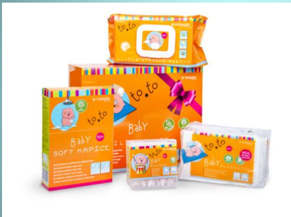
KRPICE, BLAZINICE, ROBČKI, PALČKE,...