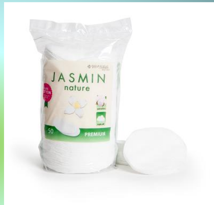
BLAZINICE IZ BOMBAŽNE VATE