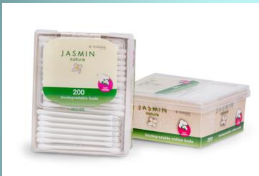
BIORAZGRADLJIVE VATIRANE PALČKE