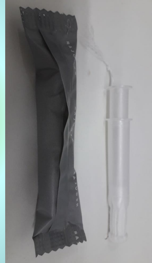
končni izdelek - TAMPON