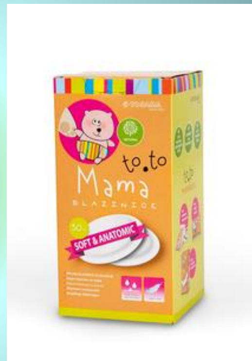
BLAZINICE ZA DOJENJE