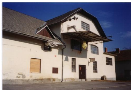
Slika 13: Velkavrhov mlin, od leta 1934 dalje Osolinov mlin.