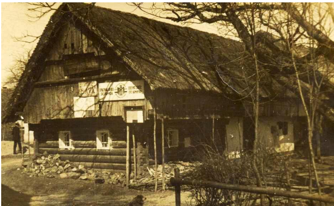
Slika 3: Kofutnikova domačija okoli leta 1925. Skoraj nespremenjena se je ohranila do danes, le da se danes nahaja pol metra pod gladino ceste.