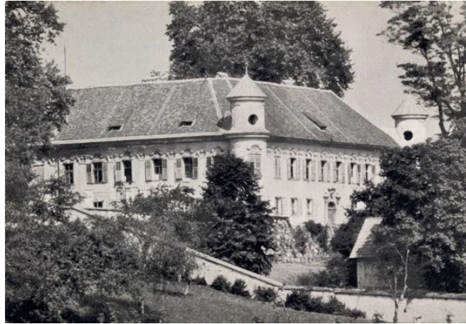
Slika 22: Grad Goričane pred drugo svetovno vojno (slika je povzeta s spletne strani Knjižnice Medvode). 21