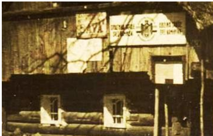
Slika 15: Pročelje Kofutnikove domačije leta 1925. Vidimo več tabel. Poleg oglasne deske in napisa Občina Jarše je viden tudi napis Zavarovalnica Sava.

»Bil je zavarovalniški agent za zavarovalnico Sava, za zavarovanje hiš in premoženja. Zato je bil tudi ta napis na hiši.«