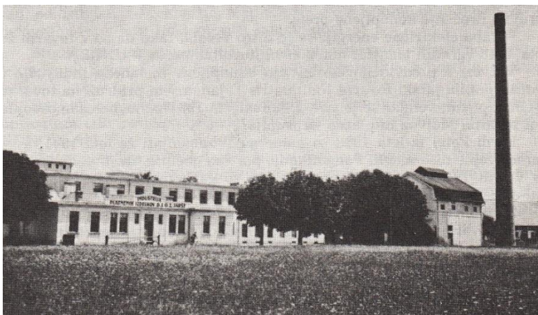
Slika 14: Tovarna Induplati leta 1932 (slika je povzeta po knjigi S. Stražarja, 1988, str. 783).

»Viktor Velkavrh je kmalu umrl. Že prej sta z Johano naredila hišo v Srednjih Jaršah. Ko je prenehal delati v mlinu, je šel kmalu delat v tovarno Induplati. Tam je vodil skladišče. Potem je bil precej let župan. Ko je bil župan, ni bil zaposlen. Ko je leta 1935 končal županovanje, je spet začel delati v tovarni Induplati. Tudi med drugo svetovno vojno, od 1941 do 1944, je hodil delat v tovarno, dokler nismo bili 9. oktobra 1944 izseljeni.«