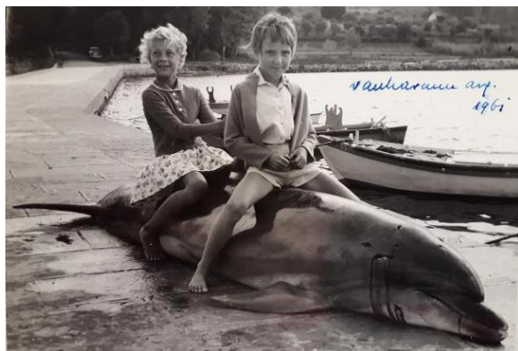
Slika 1: Na obalo je naplavilo mrtvega delfina. Ankaran, 1961.

Na morje z družino smo vsako leto odhajali v Ankaran. Potovali smo z osebnim avtomobilom. S seboj smo vzeli lopatke, kanglice, blazine, žoge in loparje za badminton. Nastanjeni smo bili v sindikalni vili. Tam smo se kopali in igrali. Na morju sem se največ družila s prijatelji in sorodniki. Vse na morju mi je bilo zelo všeč. Nenavadno pa je bilo, da je nekoč na plažo naplavilo mrtvega delfina. Z njim smo se lahko slikali. S počitnic na morju hranim več fotografij, npr. kako smo se zakopali v mivko in balinali s kamni.