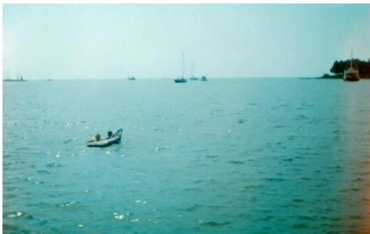
Slika 8: Jelka Urbanija z bratom Vitom v Umagu, julija 1969.

Na počitnice k sorodnikom sem odšla vsako leto dvakrat, vedno za en teden. Prebivala sem pri sorodnikih v Moravčah in Kamniku. Potovali smo z osebnim avtomobilom. Nastanjena sem bila pri tetah in njenih družinah. Tam smo se otroci igrali razne igre, pomagali smo odraslim pri delu na travniku in na polju. Največ sem se družila z bratranci, sestričnimi in njihovimi sosedovimi otroci. Najbolj mi je bilo všeč druženje, potepanje in razne družabne igre. Najbolj nenavadni pa so bili otroški padci.