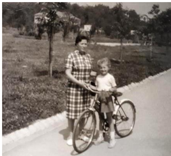
Slika 4: Počitnice v Tivoliju, Ljubljana, 1964.

Na počitnice k sorodnikom sem hodila v Črnomelj. Potovali smo z osebnim vozilom. Stanovali smo pri teti. S seboj smo vzeli tudi kopalke. Tam smo pasli krave, rabutali jabolka, pekli koruzo in se kopali v reki Dobličici. Največ sem se družila z bratranci. Najbolj so mi bili všeč skrivni izleti v naravo in kurjenje ognja. Pripetilo se mi je tudi kaj nenavadnega, npr. ko sem rabutala koruzo, me je zasačil lastnik in me zelo prestrašil. Fotografij s počitnic pri sorodnikih nimam.