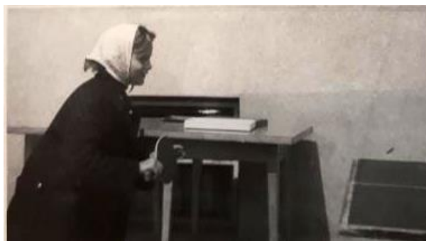
Slika 2: Igranje namiznega tenisa je bilo zelo priljubljeno, Pohorje, 1964.