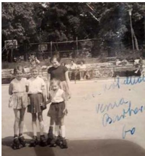
Slika 3: Počitnice doma so izkoristili tudi za kotalkanje v Tivoliju. Ljubljana, 1960.