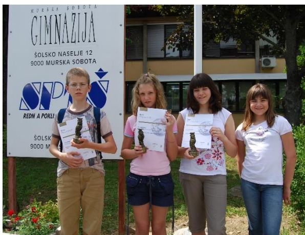
Leta 2008 so mladi raziskovalci osvojili zlato državno priznanje.