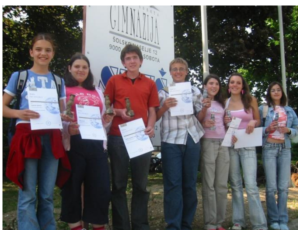
Leta 2005 so mladi raziskovalci osvojili dve zlati in dve srebrni priznanji.

Mladi raziskovalci so se vsako leto najbolj razveselili uvrstitve na državna srečanja. Do leta 2006 so vse raziskovalne naloge, ki so se uvrstile na državno srečanje, predstavili na Gimnaziji Murska Sobota. Potem so uvedli dvokrožni sistem, v katerem so raziskovalci v Murski Soboti predstavljali le šest najboljših raziskovalnih nalog na vsakem predmetnem področju, ki so se uvrstile v drugi krog državnega srečanja. Zanje so prejeli srebrna priznanja, dve raziskovalni nalogi na predmetno področje pa zlato priznanje. Od leta 2004 do 2024 so naši raziskovalci naše šole osvojili 41 bronastih, 27 srebrnih in 18 zlatih državnih priznanj . V nadaljevanju predstavljamo le mlade raziskovalce, ki so osvojili srebrna ali zlata priznanja. Fotografije iz let 2003 in 2004 se žal niso ohranile.