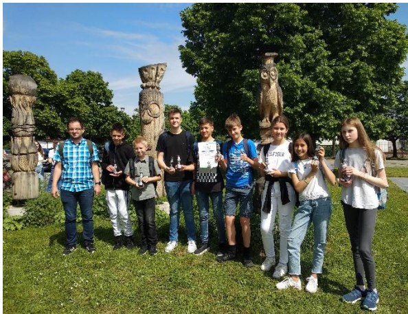
Leta 2022 so naši mladi raziskovalci osvojili pet srebrnih priznanj.