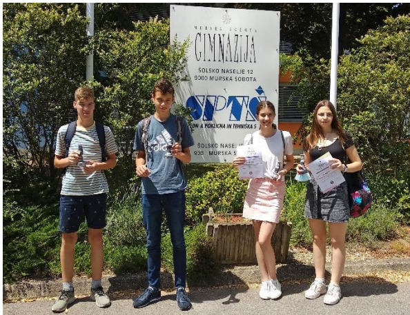
Leta 2021 so mladi raziskovalci osvojili dve srebrni in eno zlato priznanje.