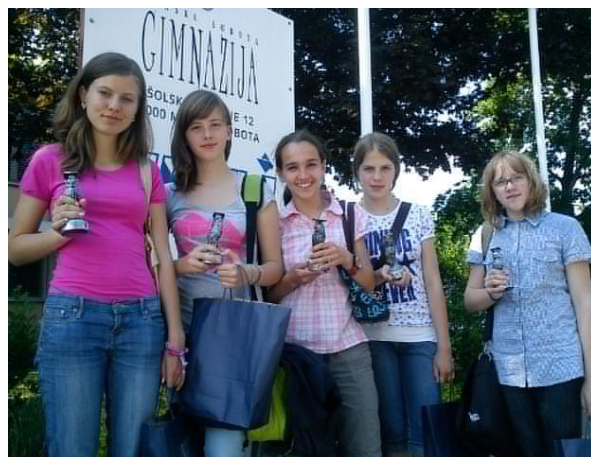
Leta 2011 so raziskovalke osvojile dve srebrni državni priznanji.