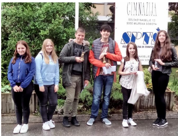
Leta 2017 so raziskovalci osvojili eno zlato in eno srebrno priznanje.