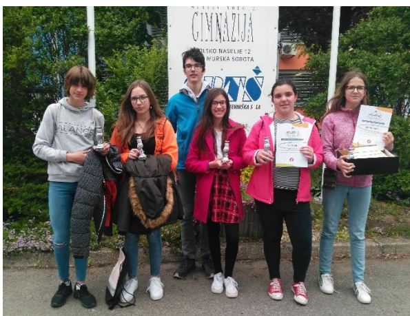
Leta 2019 so naši raziskovalci osvojili tri srebrna priznanja.