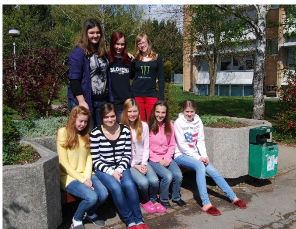
Leta 2012 so raziskovalke osvojile eno zlato in dve srebrni državni priznanji.