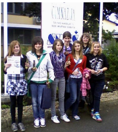
Leta 2010 so raziskovalke osvojile dve zlati in eno srebrno priznanje.