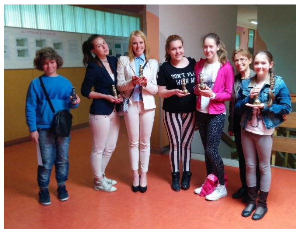
Leta 2014 so mladi raziskovalci osvojili dve zlati in eno bronasto priznanje.