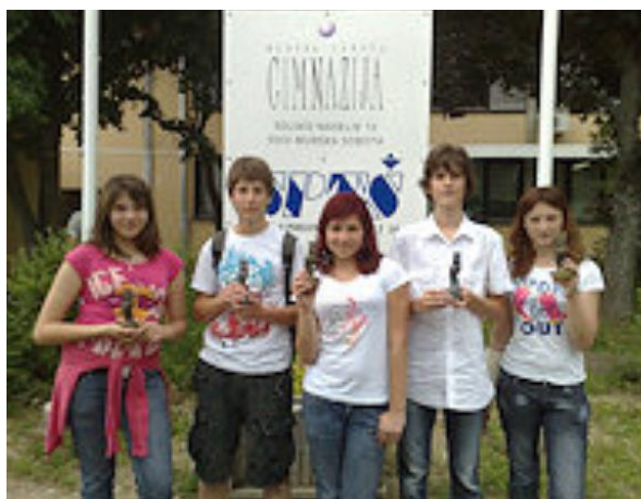
Leta 2009 mladi raziskovalci osvojili eno zlato in eno srebrno državno priznanje.