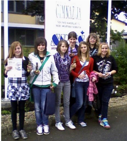
Leta 2010 so raziskovalke osvojile dve zlati in eno srebrno priznanje.