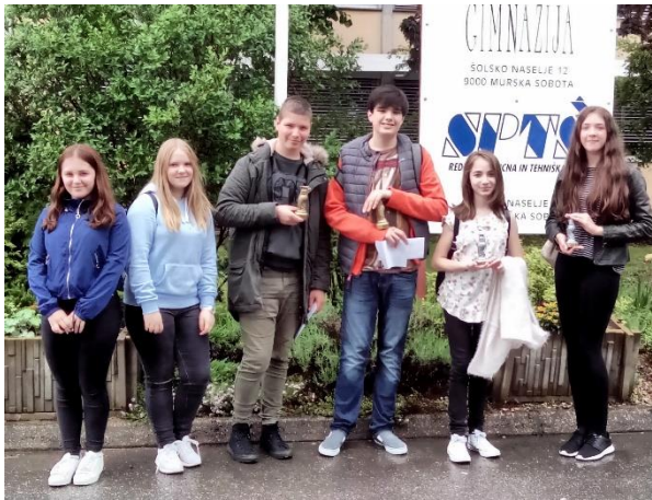
Leta 2017 so raziskovalci osvojili eno zlato in eno srebrno priznanje.