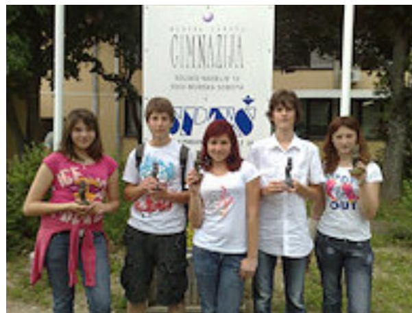
Leta 2009 mladi raziskovalci osvojili eno zlato in eno srebrno državno priznanje.