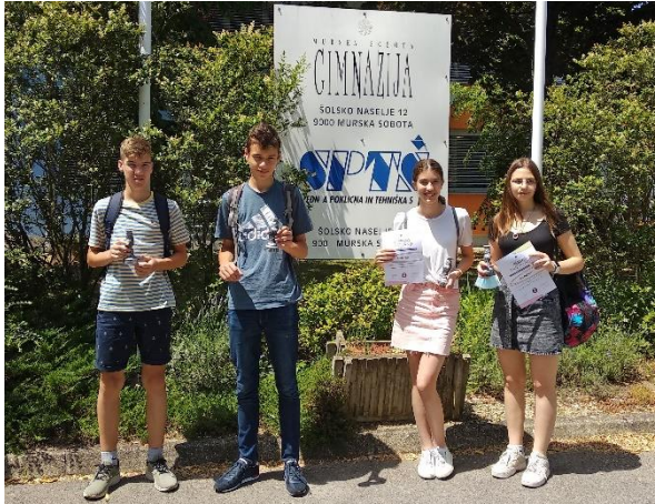
Leta 2021 so mladi raziskovalci osvojili dve srebrni in eno zlato priznanje.