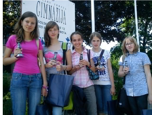
Leta 2011 so raziskovalke osvojile dve srebrni državni priznanji.