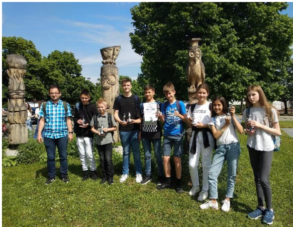
Leta 2022 so naši mladi raziskovalci osvojili pet srebrnih priznanj.