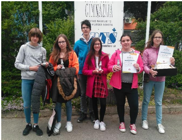
Leta 2019 so naši raziskovalci osvojili tri srebrna priznanja.