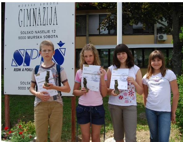
Leta 2008 so mladi raziskovalci osvojili zlato državno priznanje.