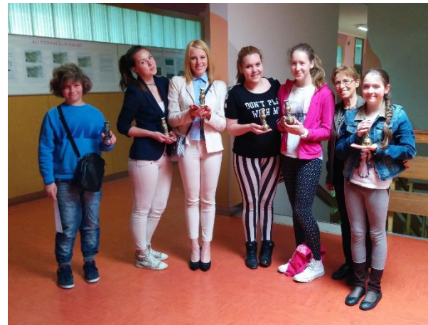
Leta 2014 so mladi raziskovalci osvojili dve zlati in eno bronasto priznanje.