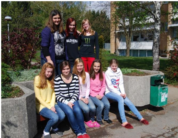
Leta 2012 so raziskovalke osvojile eno zlato in dve srebrni državni priznanji.